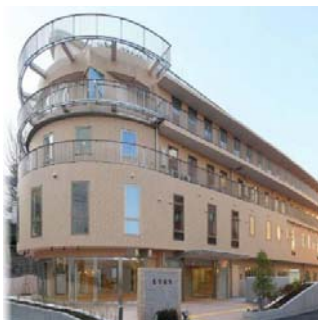
東京療院新館 (03)3280-1911 http://tokyo.moa-natural.jp 地址：東京都港區高輪4丁目9番16號