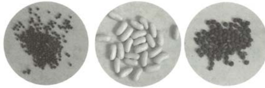
小松菜的種子 四季豆的種子 秋葵的種子

對於自然農法而言，用從自家生產的農作物所採收下來的種子播種，然後再代代相傳下去是很重要的。起初當然是先購買市販的種子來用，但是要有將來使用自家種子的打算。在購買種子的時候種苗專賣店裡頭會有許多種品牌的種子可選擇，其中的F1種的種類就算採到種子，品質也非常不穩定，盡量避免使用。可以的話盡量使用同一種品牌（這樣子採收的種子品質才會安定）。